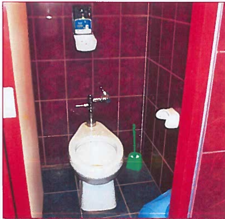
Fig. 08: Ingreso baño de estudiantes mujeres