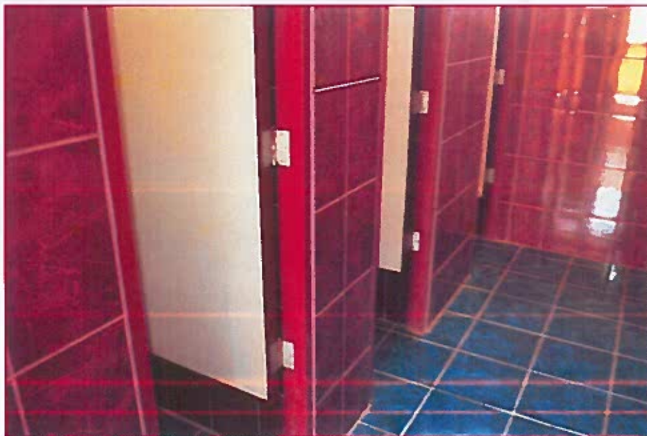
Fig. 02: Espacio exterior a los inodoros del baño de estudiantes varones