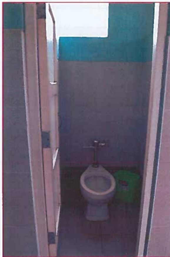
Fig. 05: Inodoros del baño de docentes mujeres