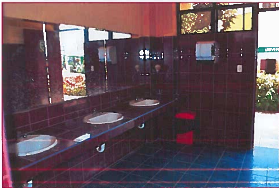
Fig. 06: Lavatorios del baño de estudiantes mujeres