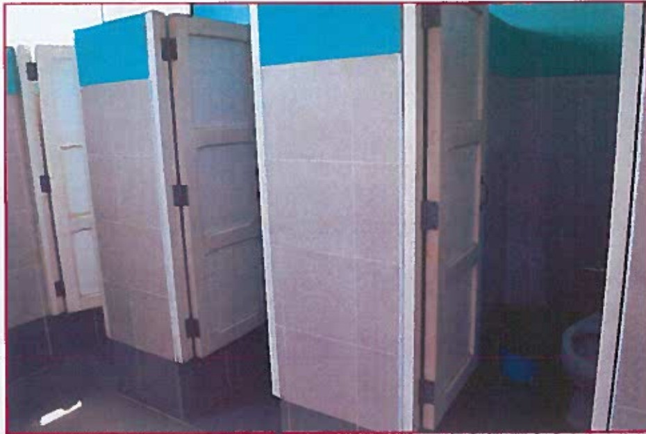
Fig. 03: Inodoros del baño de docentes varones