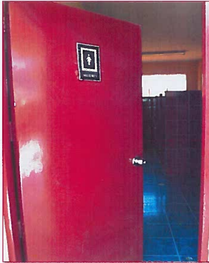
Fig. 05: Ingreso baño de estudiantes mujeres