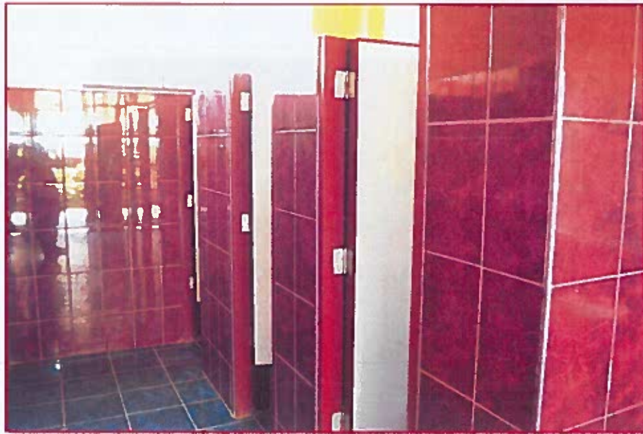
Fig. 07: Exterior de inodoros del baño de estudiantes mujeres