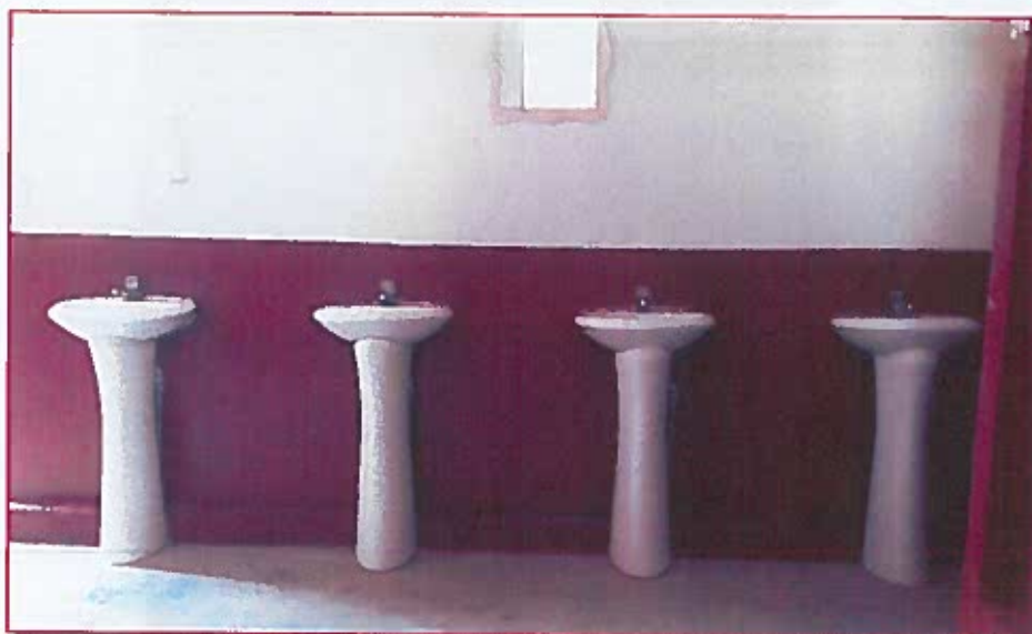
Fig. 03: Lavatorios del baño de estudiantes varones