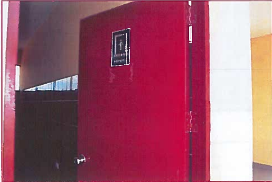
Fig. 01: Ingreso baño de estudiantes varones