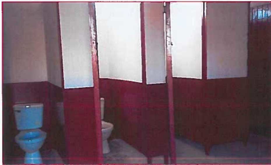
Fig. 06: Inodoros del baño de estudiantes mujeres