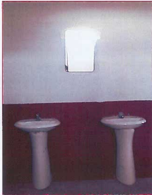
Fig. 05: Lavatorios del baño de estudiantes mujeres