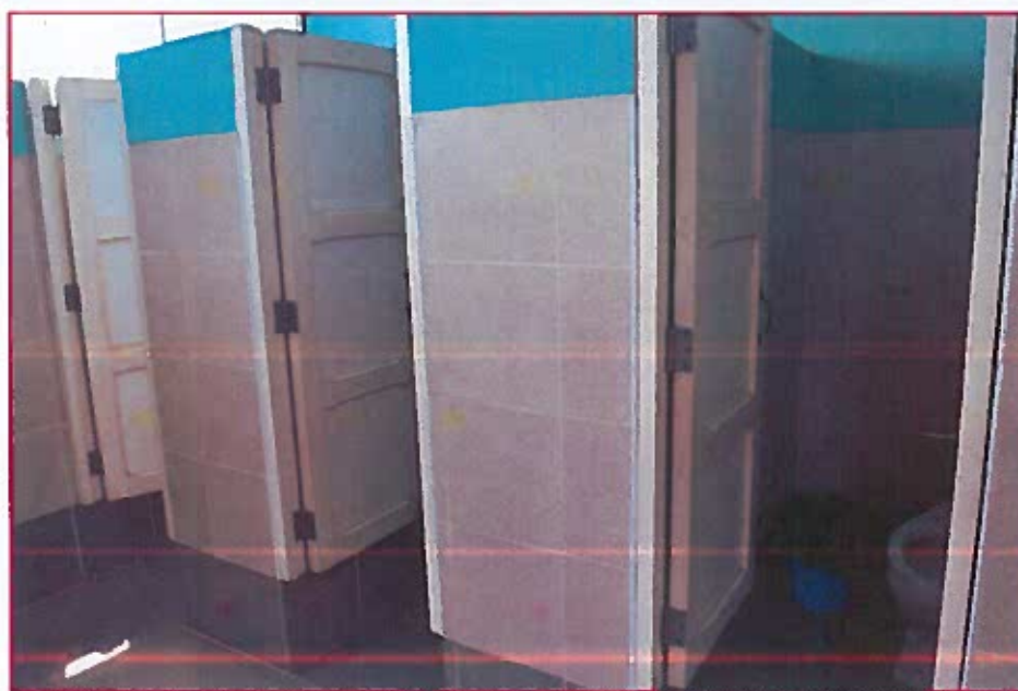
Fig. 06: Inodoros del baño de docentes mujeres