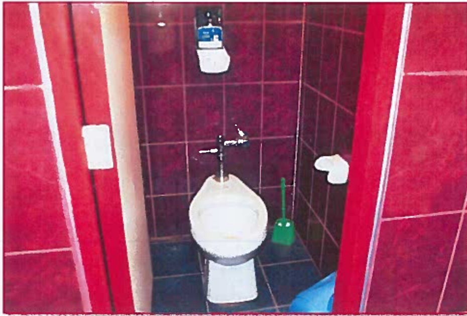
Fig. 03: Inodoros del baño de estudiantes varones