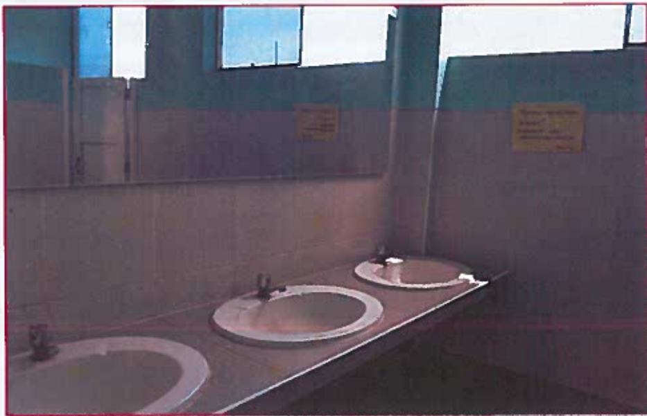
Fig. 04: Lavatorios del baño de docentes mujeres