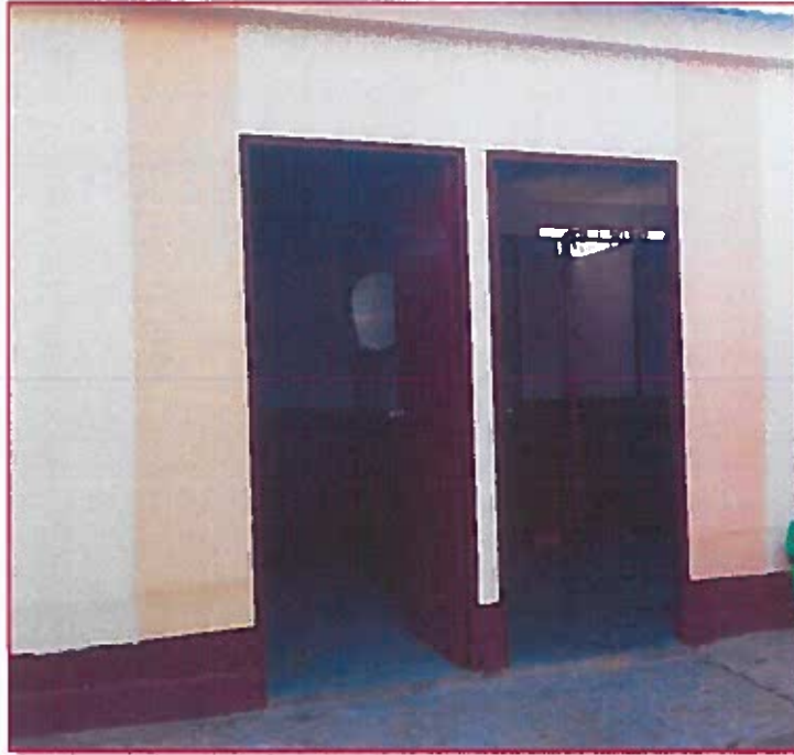
Fig. 01: Puerta izquierda de acceso a baño de estudiantes varones