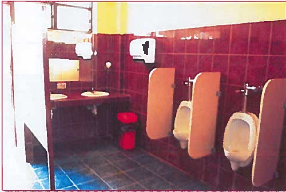
Fig. 04: Urinarios y lavatorios del baño de estudiantes de varones