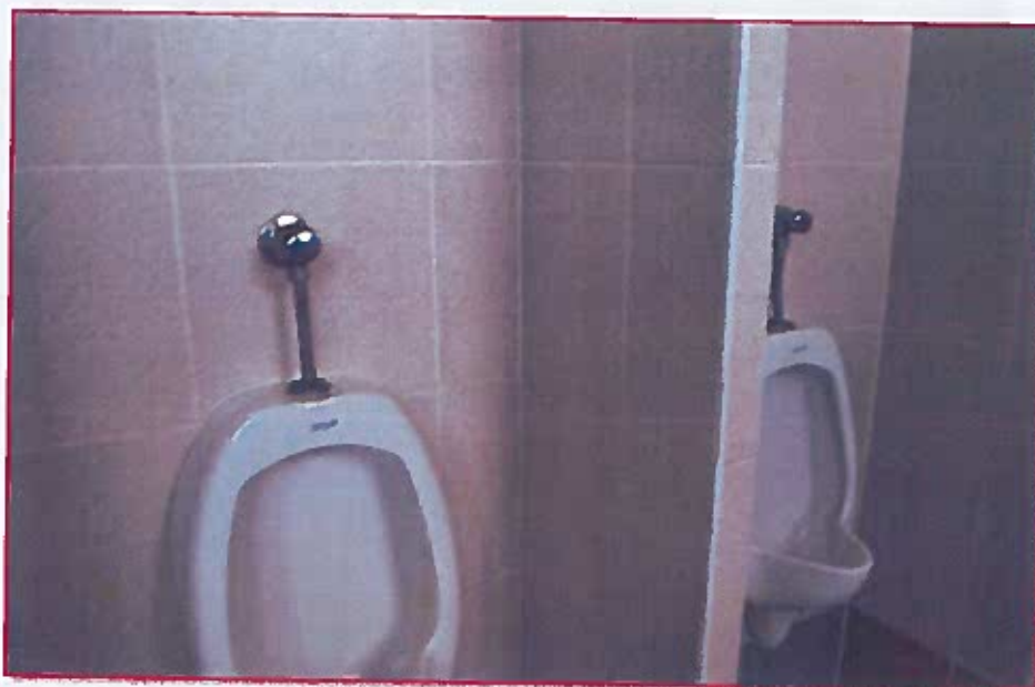
Fig. 01: Urinarios del baño de docentes varones