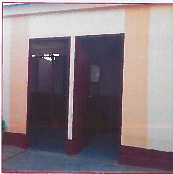
Fig. 04: Puerta derecha de acceso a baño de estudiantes mujeres