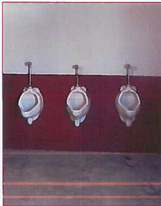
Fig. 02: Urinarios del baño de estudiantes varones